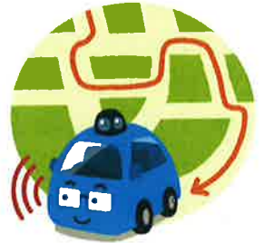
目的地まで車が連れて行ってくれる時代に!

人が運転操作しなくても車が目的地まで自動で運転してくれる、いわゆる「自動運転車」が注目されています。自動車メーカーはもちろん、自動車製造に関わっていない企業の参入や、政府と民間企業が共同開発を始めるといった動きもみられたりするなど、その状況は日に日に進んでおり注目です。