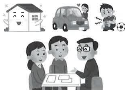
それぞれの保険に告知義務、通知義務の事項があります。

また、違反がわかれば、保険会社側から保険契約を解除することがありますので、正しい申告が必要です。