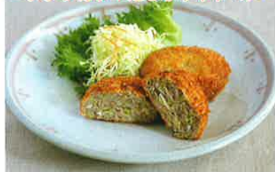
～メンチカツ+たっぷりキャベツ～