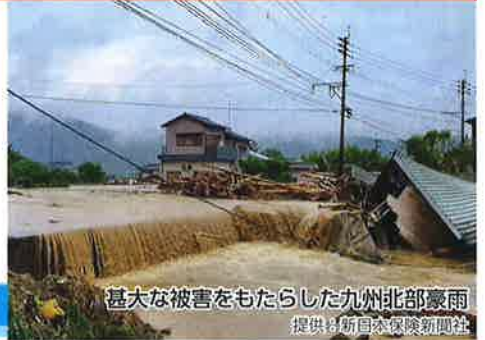
甚大な被害をもたらした九州北部豪雨

日本にはさまざまな災害リスクが潜んでいます。地震や津波、火災、大雨洪水、浸水、豪雪…。今やそのどれもがいつ自分の地域で発生してもおかしくありません。日ごろから、災害リスクに対する意識を高く持ち、万一のときのために備えた対策をしておきたいものです。