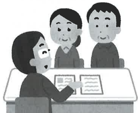
納得いくまで相談しよう！