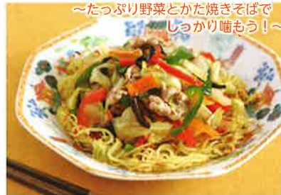
～たっぷり野菜とかた焼きそばでしっかり噛もう!～